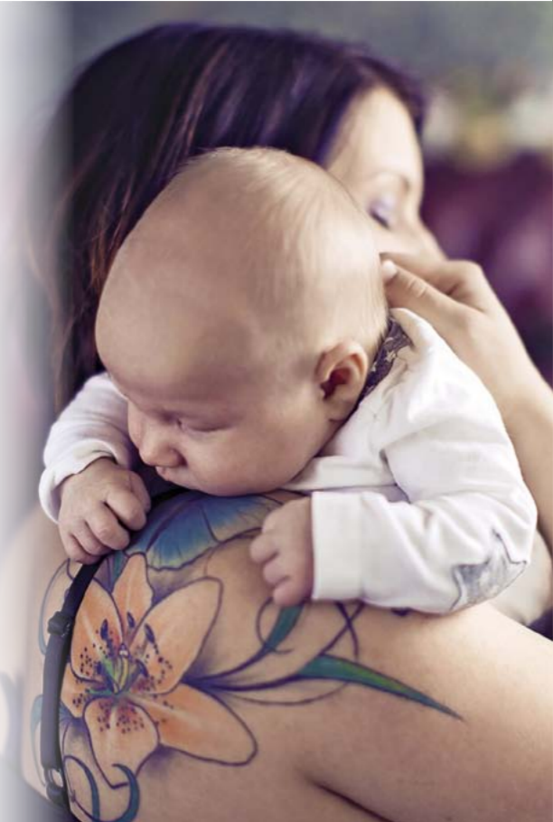
Kaava Inalo Creative

Väestöliitto tuottaa yhteiskuntaan hyvinvointia monin eri tavoin. Väestöliitto ry vaikuttaa lapsi- ja perheystävällisen sekä oikeudenmukaisen yhteiskunnan puolesta, tekee kehittämistyötä sekä harjoittaa tutkimusta. Väestöliiton yhtiöt puolestaan tuottavat laadukkaita, ihmisläheisiä palveluja. Yhtiöiden tuotto ohjataan kokonaisuudessaan Väestöliitto ry:n yhteiskunnalliseen vaikuttamistyöhön.